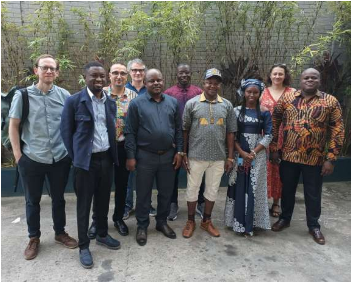
Photo 1. Certains des participants du 7 ème comité du pilotage du Réseau de Recherche sur les Forêts d’Afrique Centrale le 24 novembre 2025, Libreville, Gabon.

Le 7 ème comité de pilotage du Réseau de Recherche sur les Forêts d’Afrique Centrale (R2FAC) a été organisé le 24 novembre 2025 à l’IRET à Libreville au Gabon. Le comité de pilotage a été organisé en marge de la conférence sur les écosystèmes forestiers d’Afrique Centrale du programme RESSAC afin de profiter de la présence des membres du R2FAC à Libreville pour cet événement scientifique.